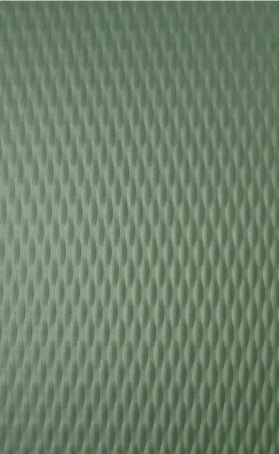
PIGMENTO® grün SEPG-Z5